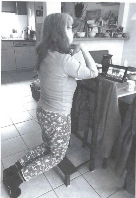
Buzgó részvétel otthon az online szentmisén